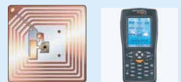
Codes barre & RFID